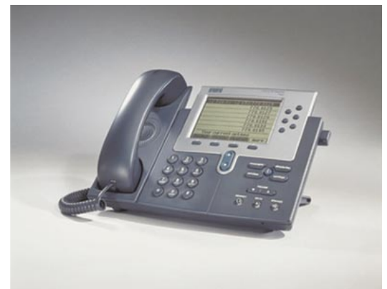
Figure 1 Téléphone IP Cisco 7960

fonctions d'appel. Il comporte également un grand écran à cristaux liquide. Cet écran permet l'affichage d'informations telles que l'heure et la date, le nom de l'appelant, son numéro de téléphone et les numéros composés. Ses possibilités graphiques permettent l'intégration de fonctions actuelles et futures.