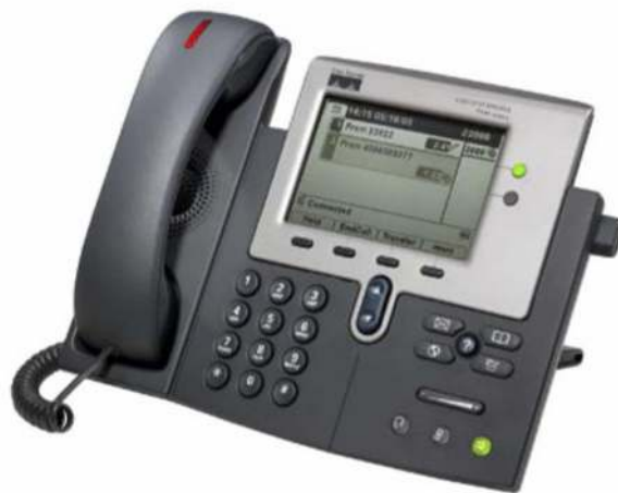
Figure 1. Le téléphone IP Cisco Unified 7941G-GE

Capable de fournir une bande passante illimitée à vos applications de bureau, le téléphone IP Cisco® Unified 7941G-GE est équipé des plus récentes technologies et des derniers progrès de la téléphonie VoIP Gigabit Ethernet. Avec son port Gigabit Ethernet pour l'intégration avec un PC ou un serveur de bureau (Figure 1), il permet à vos utilisateurs d'accéder rapidement aux données et aux applications du réseau. Disposant de fonctions identiques à celles du Cisco 7941G, ce téléphone IP Gigabit Ethernet amélioré pour l'entreprise présente deux boutons rétroéclairés programmables pour des lignes ou des fonctions et quatre touches interactives programmables qui guident l'utilisateur à travers les diverses caractéristiques et fonctions de l'appel. Il offre aussi des réglages audio pour les hauts parleurs duplex de haute qualité, le combiné et le casque. Son grand écran LCD de grande résolution à échelle de gris permet d'accéder facilement aux informations de communication, aux applications optimisées et aux diverses fonctionnalités de l'appareil (Figure 2). Il donne également aux utilisateurs et aux développeurs la possibilité d'installer à l'écran davantage d'applications innovantes et productives en langage XML (Extensible Markup Language) et peut afficher à l'écran des langues à « double octet ».