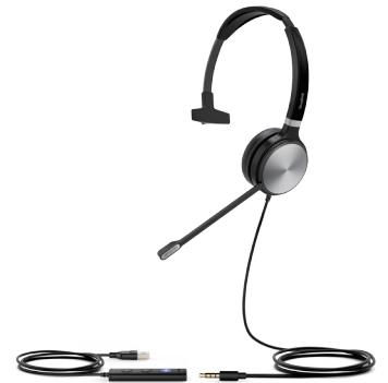
UH36 Mono Teams UH36 Mono UC

Intégration en profondeur avec les téléphones IP Yealink, pour que leurs fonctionnalités avancées, comme la synchronisation du volume et le contrôle des appels multiples soient à portée de main.