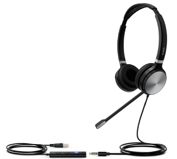
UH36 Dual Teams UH36 Dual UC