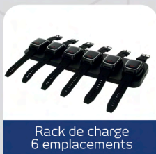
Rack de charge 6 emplacements