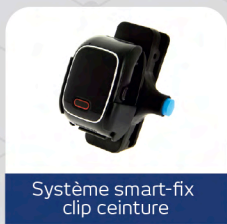
Système smart-fix clip ceinture