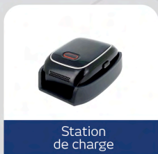
Station de charge