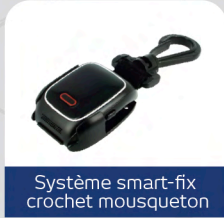
Système smart-fix crochet mousqueton