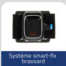
Système smart-fix brassard