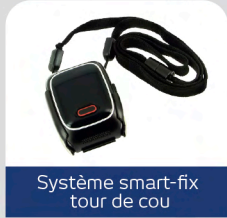
Système smart-fix tour de cou