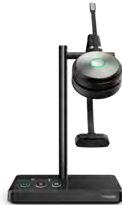
WH62 Mono Teams WH62 Mono UC